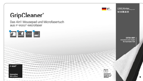
Ansicht der fertigen Einlegekarte